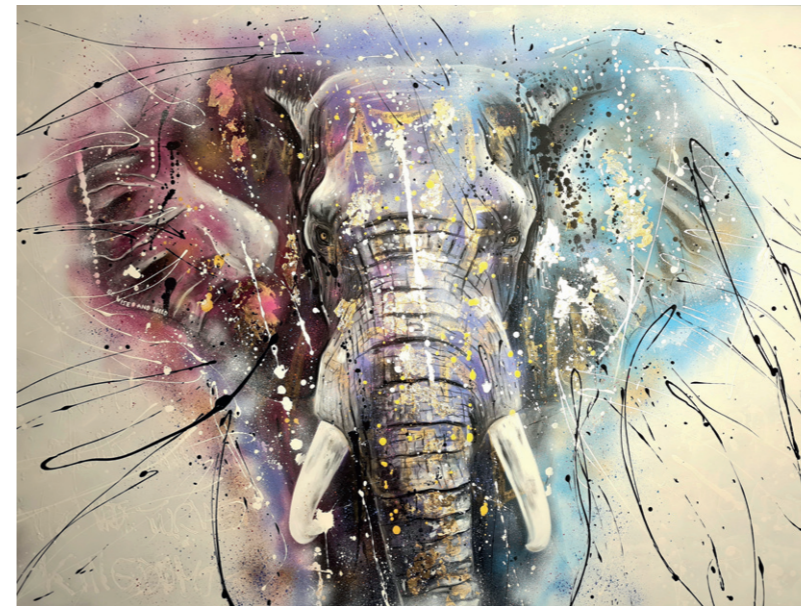
Loxodonta africana , Acryl auf Leinwand, 150 x 200 cm

Inspiziert von der Anmut und Einzigartigkeit der Natur hält Rosi Tretter Tierporträts in Acryl auf Leinwand fest. Jedes ihrer Bilder erzählt die Geschichte einer Kreatur, die in ihrer Pracht gleichzeitig auf ihr drohendes Verschwinden verweist und damit auch die Frage stellt, welche Verantwortung wir für den Erhalt der ebenso wunderbaren wie vielfältigen Tier- und Pflanzenwelt unseres Planeten tragen. „Ich versuche mit meinen Kunstwerken, Augenblicke der Schönheit festzuhalten, um somit dem Vergessen entgegenzuhalten, bevor bestimmte Tierarten möglicherweise für immer verschwinden“, beschreibt Rosi Tretter ihren künstlerischen Ansatz. „Es ist meine Überzeugung, dass Kunst eine Kraft hat, die Menschen bewegt und zum Handeln anregt. So möchte ich meinen kleinen Beitrag leisten, um die bedrohten Tiere und ihren Lebensraum zu schützen.“