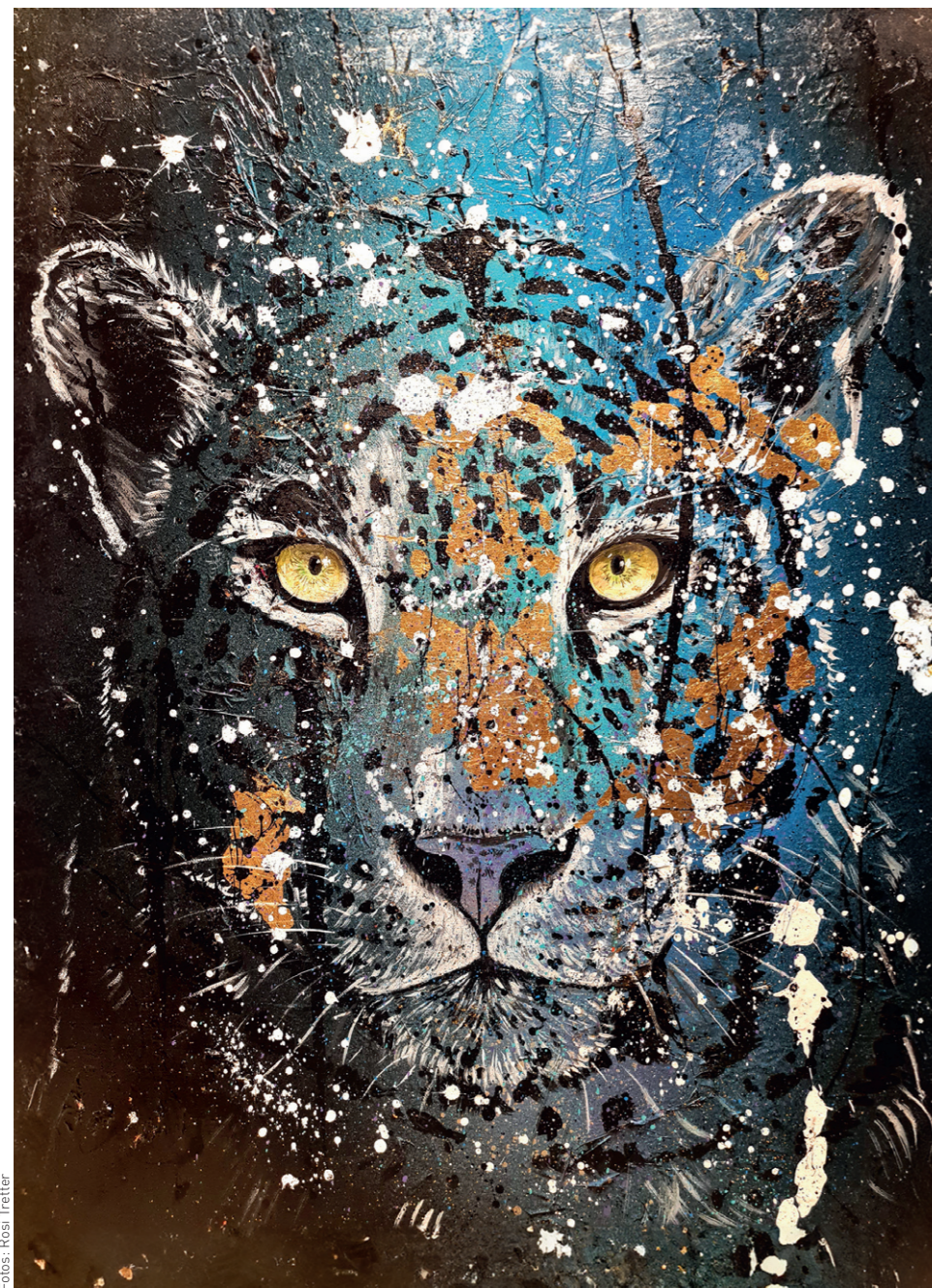
Panthera pardus I , Acryl auf Leinwand, 80 x 60 cm

Inspiziert von der Anmut und Einzigartigkeit der Natur hält Rosi Tretter Tierporträts in Acryl auf Leinwand fest. Jedes ihrer Bilder erzählt die Geschichte einer Kreatur, die in ihrer Pracht gleichzeitig auf ihr drohendes Verschwinden verweist und damit auch die Frage stellt, welche Verantwortung wir für den Erhalt der ebenso wunderbaren wie vielfältigen Tier- und Pflanzenwelt unseres Planeten tragen. „Ich versuche mit meinen Kunstwerken, Augenblicke der Schönheit festzuhalten, um somit dem Vergessen entgegenzuhalten, bevor bestimmte Tierarten möglicherweise für immer verschwinden“, beschreibt Rosi Tretter ihren künstlerischen Ansatz. „Es ist meine Überzeugung, dass Kunst eine Kraft hat, die Menschen bewegt und zum Handeln anregt. So möchte ich meinen kleinen Beitrag leisten, um die bedrohten Tiere und ihren Lebensraum zu schützen.“