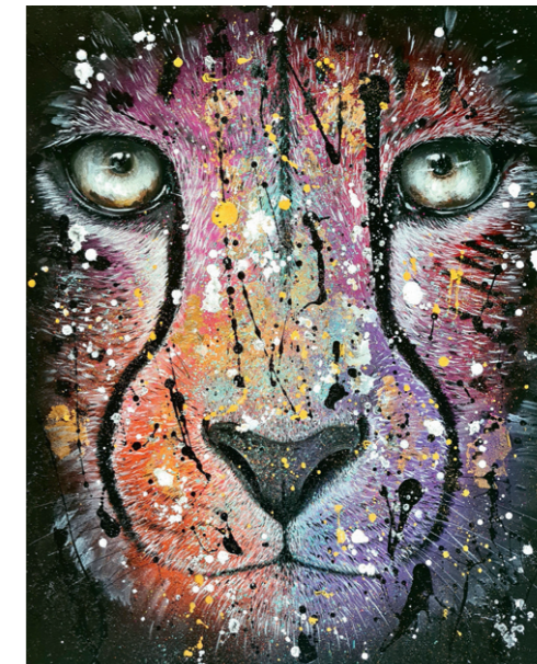
Acinonyx jubatus , Acryl auf Leinwand, 100 x 80 cm